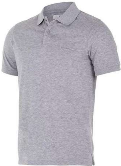
CAMIBUSO POLO MANGA CORTA