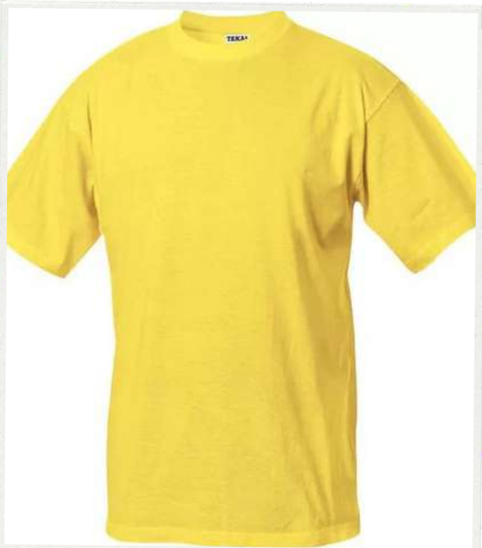
CAMISETA MANGA CORTA