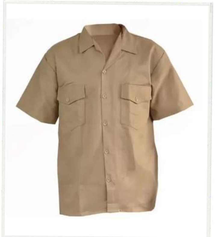
CAMISA LABORAL MANGA CORTA

Elaboradas en tela Dril Raza, son frescas y permiten una excelente movilidad, cuentan con costuras reforzadas que garantizan su resistencia, es ideal para trabajos de campo y cualquier labor que requiera protección.