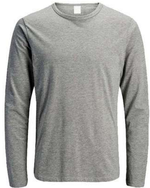
CAMISETA MANGA LARGA

Camiseta con cuello redondo elaborada en tela de algodón 100% con cuello en rib, costuras reforzadas, ideal para uso diario como mensajería, logística, asistencia, almacenamiento, entre otros. Esta camiseta de dotación es de corte unisex, ideal para bordar o estampar logotipo.