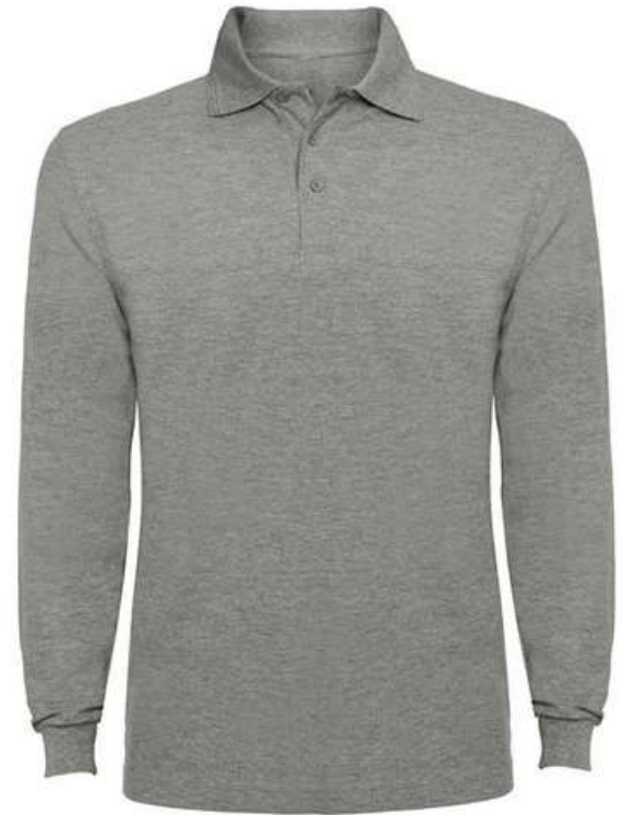
CAMIBUSO POLO MANGA LARGA

Camiseta tipo polo clasica elaborada en algodón, ideal para cualquier ocasión. Elaboradas en tela piqué 100% algodón, ribete en contorno del cuello, 3 botones, costuras laterales