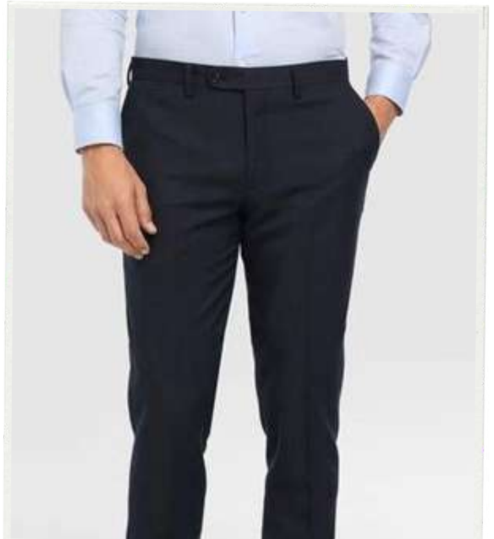
PANTALON EJECUTIVO HOMBRE

Elaborados en tela lino vértigo stretch de alta calidad, son cómodos, no requiere planchado, viene en corte recto con pretina ancha, es un pantalón ideal para empleados ejecutivos o secretarias