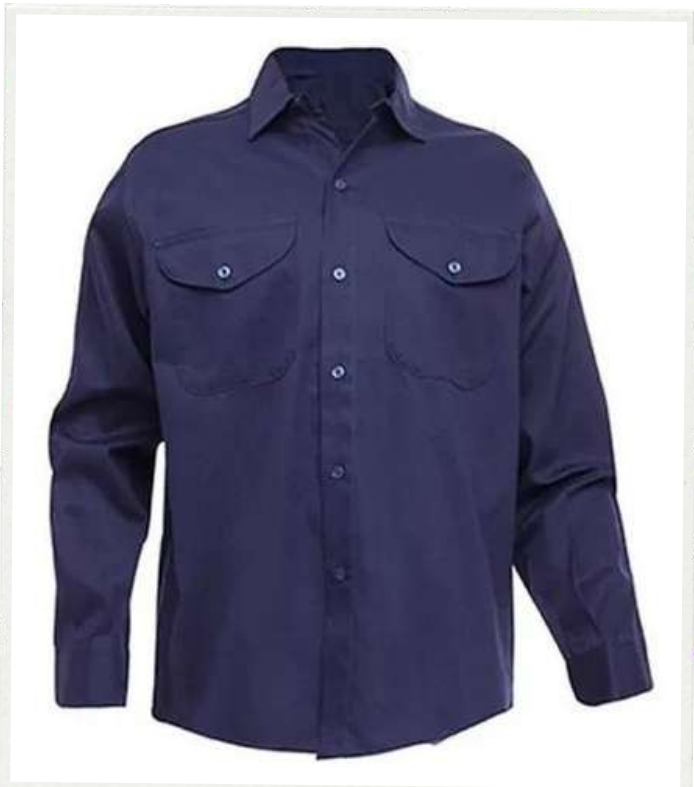
CAMISA LABORAL MANGA LARGA