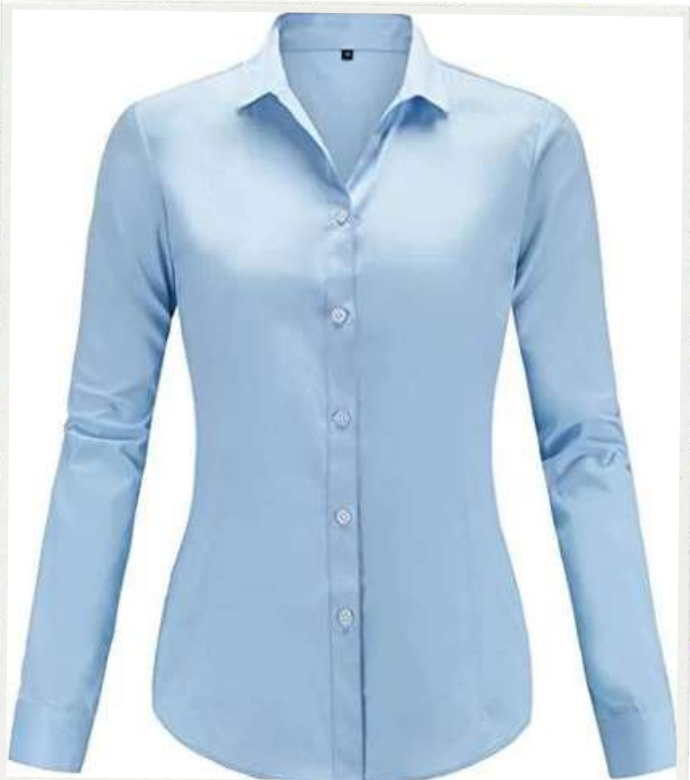
BLUSA EJECUTIVA MANGA LARGA