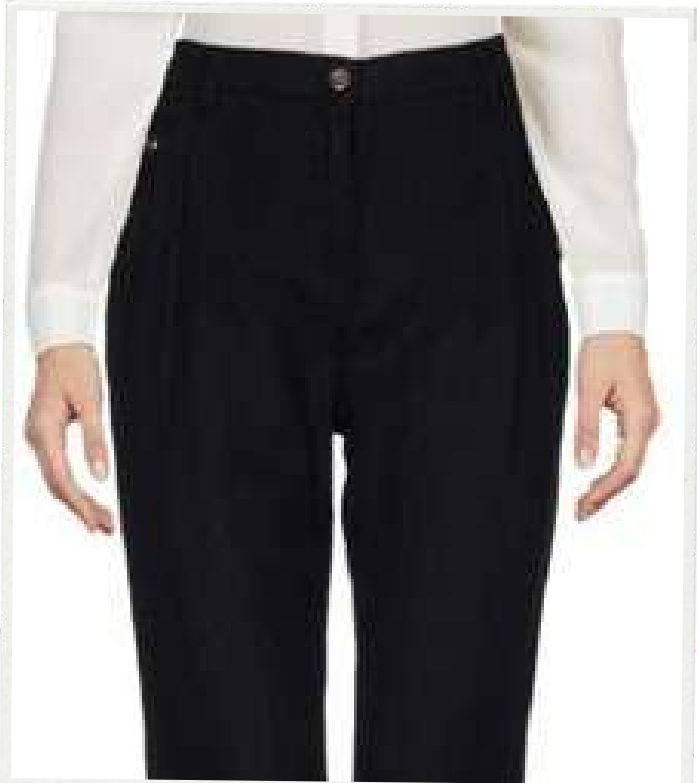
PANTALON EJECUTIVO DAMA