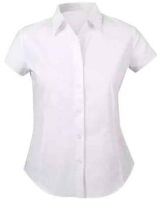
BLUSA EJECUTIVA MANGA CORTA

Elaboradas en tela Oxford o Lafayette, son confortables para el uso diario, suave, elegante, de fácil cuidado y fácil de lavar, no se arruga fácilmente